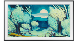
The Frame 2025