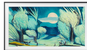
The Frame 2025