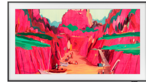
The Frame Pro 2025