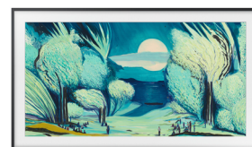
The Frame 2025